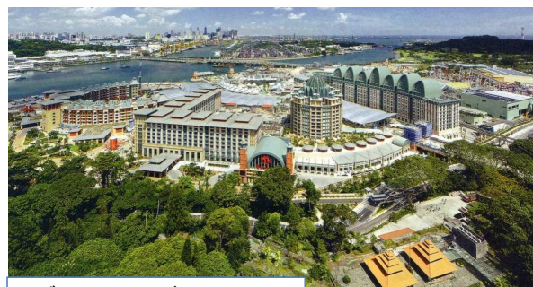
リゾート・ワールド・セントーサ