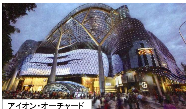
アイオン・オーチャード