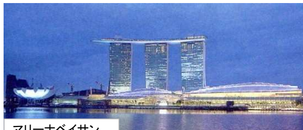
マリナーベイサンズ